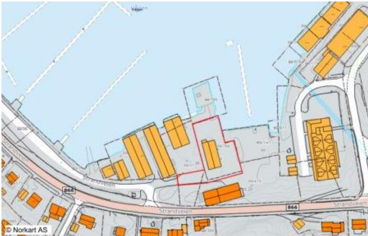
Figur 3. Planområdet er avgrenset med rød linje.