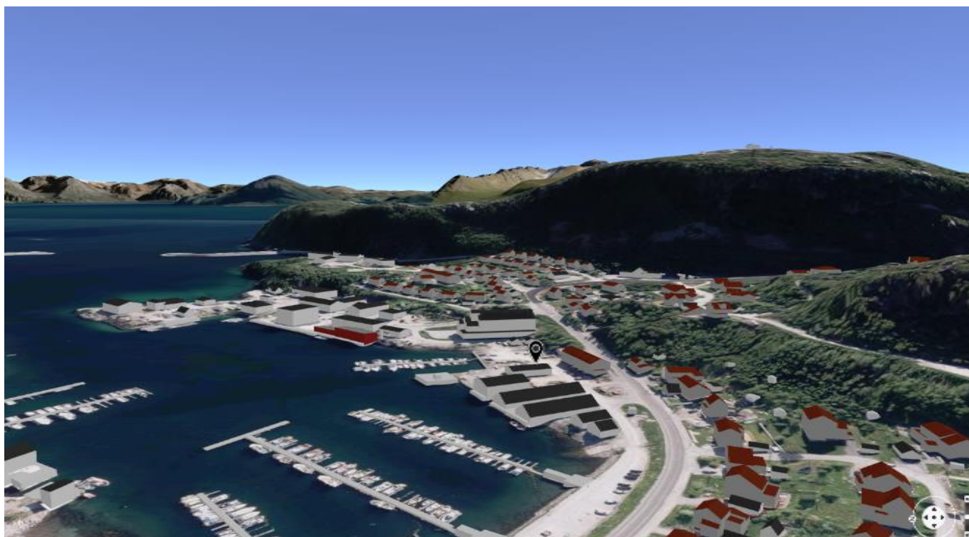
Figur 1. Oversiktsbilde fra Kommunekart.com