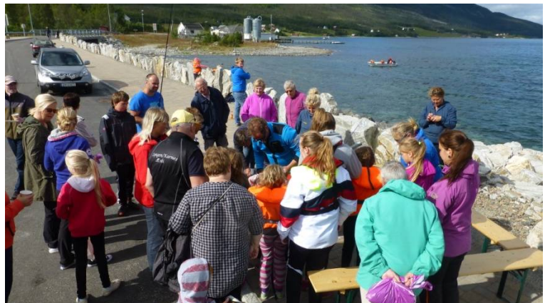
Fra Heimkommardagen i 2014